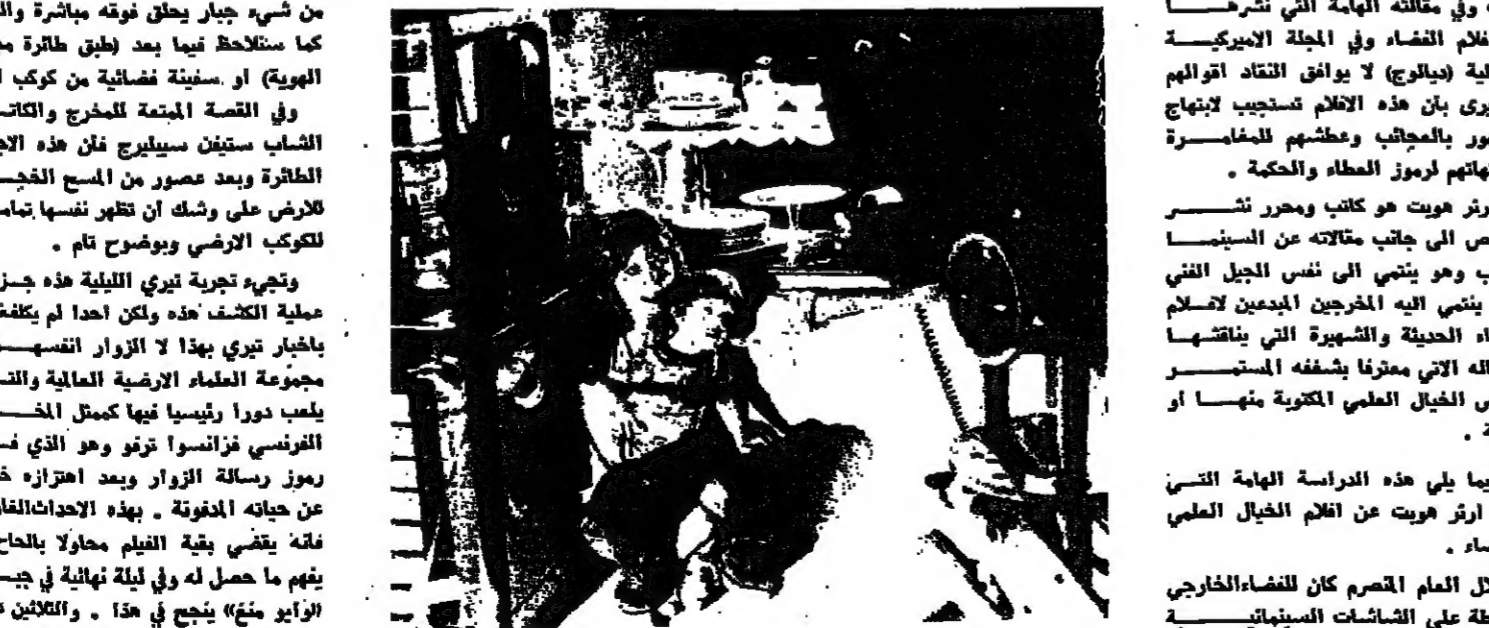
من فيلم «لقنارات من النوع الثالث»

ريادة الفضاء والمخلوقات الكونية (المتوعدة منها والطيقة) هي أسس أحد أقدم الاساليب السينمائية ، وقيل ان يضع رواد القضاء اقتدامهم على القمر بمدق طوية كانت هناك افلام عن الفضاء .. والان وفي منتصف عصر الفضاء ابتداء انتاج هذه الافلام بذكاء تكتيكي متأن وجديد . وفي العام الماضي اصبح فيلم «الصراب الكواكب» امج الافلام التي تم انتاجها حتى الان و «القنارات قريبة من الترح الثالث» لا يترجح بعيدا خلفه وقد اطلق بعض النقاد على هذين القبلين القبا مثل «السفينة» — الحرب الكوكبية او الخالية من الجيدة — القنارات قريبة من الترح الثالث ولكن النقد والباحث البيروكي المعروف ارثر هويت وفي مقالته الهامة التي نشرها عن افلام الفضاء في المجلة البيروكية الفصلية (ديالوج) لا يوافق النقاد اقوالهم فهو يرى بان هذه الافلام تستجيب لانجاش الجمهور بالمعجب وعظمتهم للفضاء واشهرتهم لرموز الفضاء والحكمة . وارثر هويت هو كاتب ومحرر نشتر القصص الى جانب مقالاته عن السينما والاب وهو ينتمي الى نفس الجيل الفني الذي ينتمي اليه المخرجين المبدعين لافلام الفضاء الحديثة والشهرة التي بناقشها في مقالتي معترفا بشغفه المستمر لنقص الخيال العلمي الكونية منها او الغريبة .